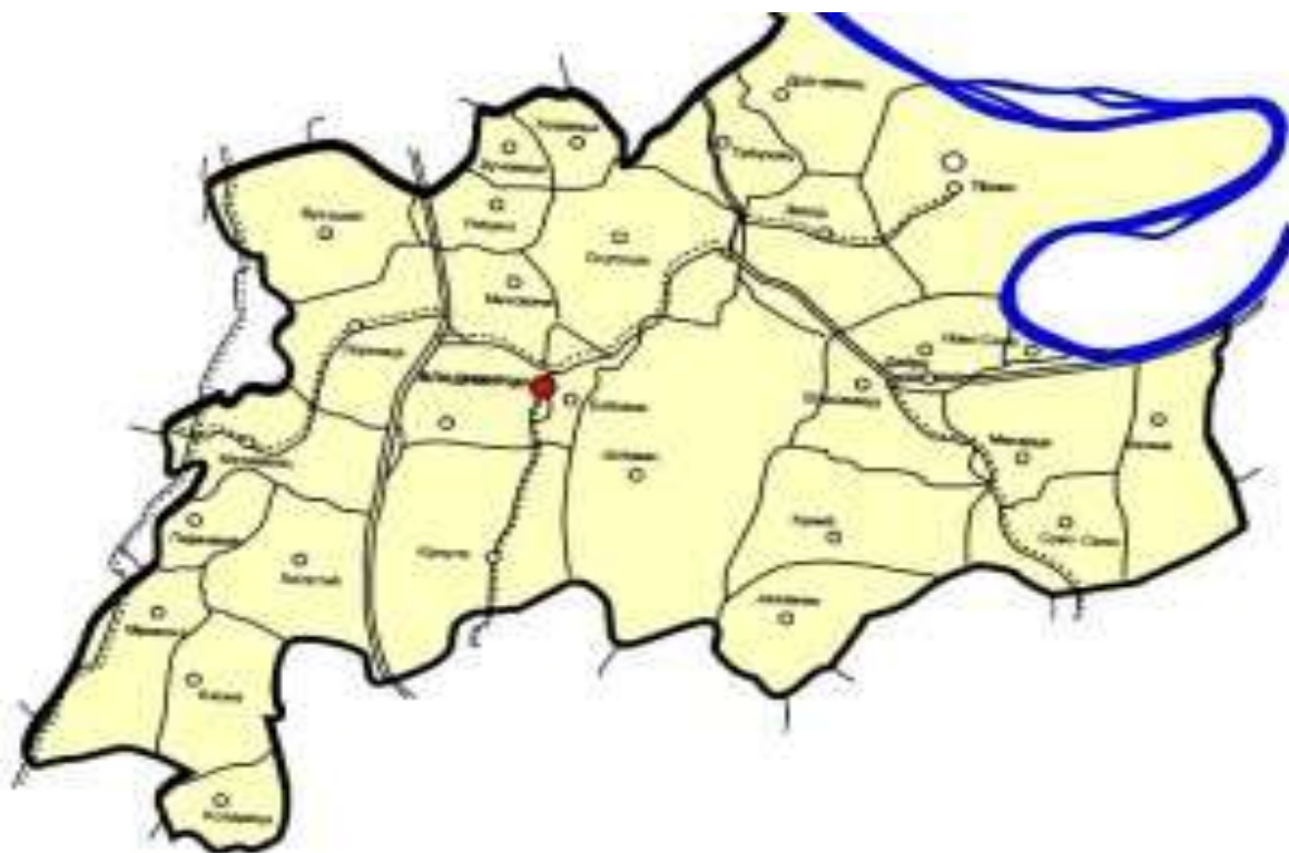
КАРТА ОПШТИНЕ ВЛАДИМИРЦИ РАЗМЕРА 1:100 000