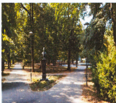
Слика 3. Биста Ј. Веселиновић