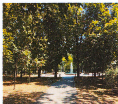
Слика 4. Фонтана у центру парка