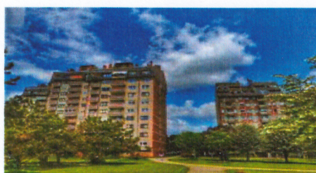
Слика 9 и 10. Стамбено насеље Тркалиште

Назив зелених површина блоквског зеленила приказан је у табели: