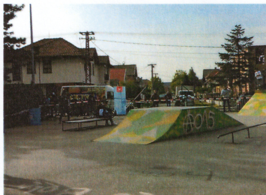
Слика 6. Скејт парк на Живинарнику