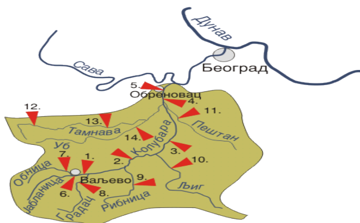
Слика 1: Мрежа хидролошких станица површинских вода – слив Колубаре (црноморски слив)